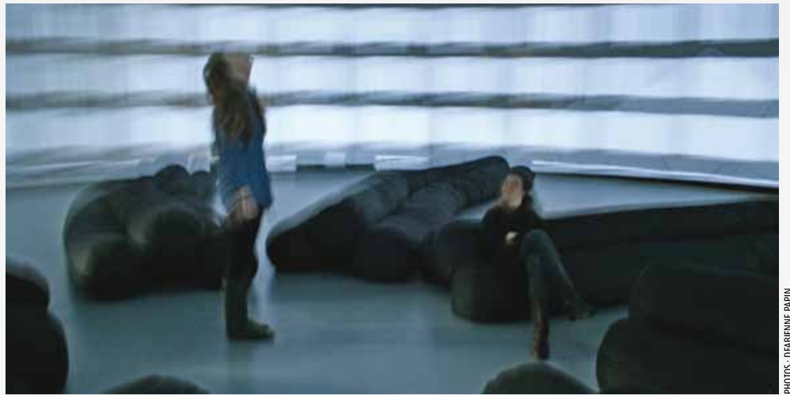
DANS LA SATOSPHERE, LES JEUNES TESTENT DIFFÉRENTES AMBIANCES QUI LEUR PERMETTENT ENTRE AUTRES D'APAISER LEUR ANXIÉTÉ, D'EXPÉRIMENTER DANS UN ENDROIT SÉCURITAIRE LA SENSATION DE SE RETROUVER AU MILIEU D'UNE FOULE OU ENCORE D'EXPRIMER DIFFÉRENTS RESENTIS.